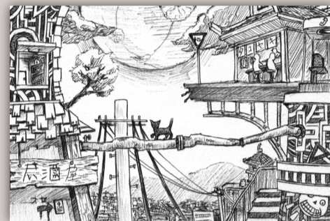
『工業商店街』 絵・杉本 明聡

この新聞に載せていただいてから幾つか絵を描いてきましたが、今回は風景に挑戦してみました。なかなか思ったようには描けませんでした、いつかイメージ通りに描き起こせるくらい上手になりたいです...(汗)