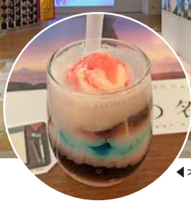
◀オリジナルメニュー、「流星のシーン」をイメージしたゼリーのソーダ